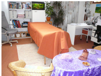
Praktijkruimte met behandeltafel

Iedereen heeft weleens een periode van teveel spanningen op het werk of thuis. Dat kan bijvoorbeeld komen door wrijving met bepaalde mensen van wie je juist steun zou willen krijgen, of je zit aan de top van je kunnen en men vraagt toch nog meer van je. Soms duurt het herstel na een operatie of ziekte langer dan verwacht of zijn er andere lichamelijke klachten.